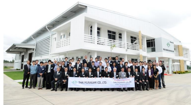
開所式 (2014 年 7 月 19 日)

従 業 員 数 5 名 (日本人 2 名含む、2014 年 8 月現在) 10 名 (日本人 3 名含む、2015 年予定) 15 名 (日本人 3 名含む、2016 年予定)